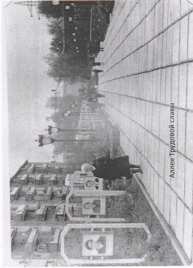
Аллея Трудовой славы

В 1985 году в Невьянке был построен городской мемориальный комплекс, а в 1986 была открыта аллея Трудовой славы.